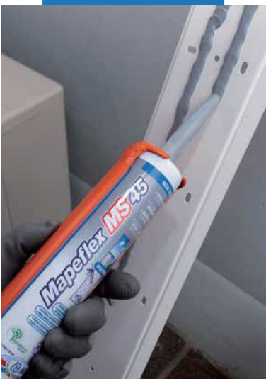
在外表面上粘结塑型材